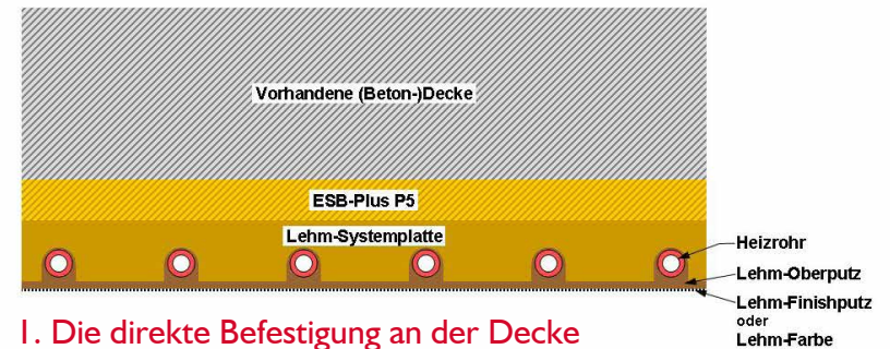
1. Die direkte Befestigung an der Decke

Für die Befestigung der Lehmmodule gibt es drei Grundvarianten: